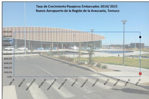
Gráfico 1: Tasa de Crecimiento últimos 12 meses

(***) Corresponde a variación acumulada julio 2015 respecto similar periodo 2014 (los pasajeros acumulados al mes de julio 2014 corresponden al Aeródromo Maquehue).